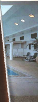
(pan) Indors Hotel n Pazifischen ditioneller ja- ein Spa, das ienparadies.